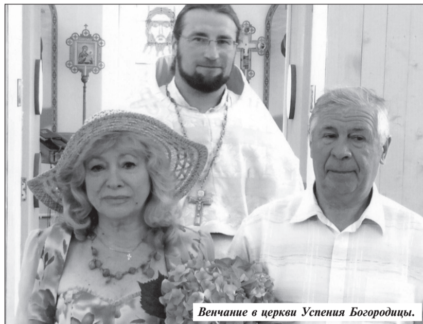
Венчание в церкви Успения Богородицы.

натную квартиру — своего рода площадку для всяких придумок. Уютная, хорошо обустроенная, ее двери всегда гостеприимно распахнуты.